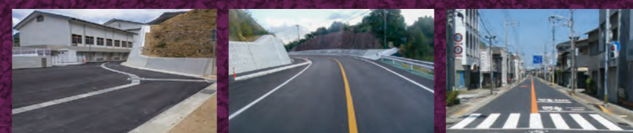
県立高校舗装工事