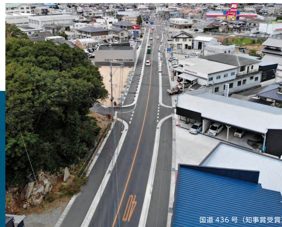
国道436号（知事賞受賞）

わが社の土木事業は、河川、砂防ダム及び道路工事を中心とした土木全般を手掛けております。近年では、広域水道企業団の設立に伴い水道事業にも注力しております。受注は行政発注の公共工事が大半を占めており、高品質・安全性の確保に努め、国道436号（双子浦工区）の道路工事においては令和2年度知事賞を受賞しております。また、民間工事においては商業施設の造成工事から個人家屋の擁壁工事・浄化槽工事まで幅広く事業を展開しております。