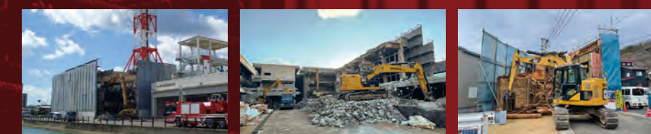
消防本部解体工事