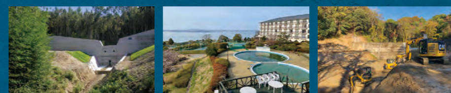
虻川通常砂防工事